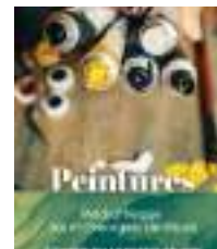
école en rouge