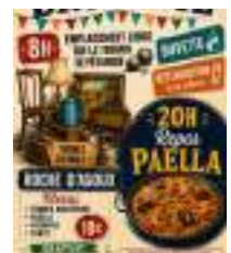
© Association Amicale Laïque de Roche d'Agoux