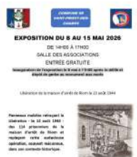
©exposition sur la libération de la maison d'arrêt