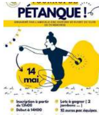
© Ouvert à tous. Inscription à partir de 14h. Un lot à chaque participant. Tarifs: 10€, 2e prix: 2 roses, 3e prix: 2 services à fond. Restauration, buvette et convivialité assurées!