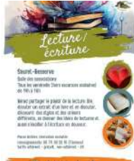
© Association Au Fil de l'eau