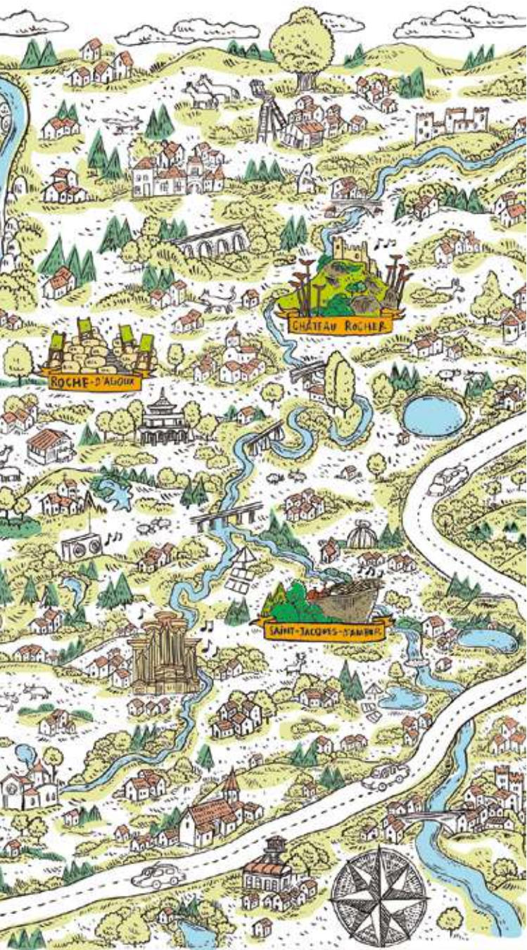
création graphique d'Elza Lacotte ♥ Atelier du Zef