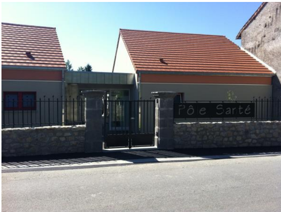
Bâtiment du Pôle de Santé au Montel-de-Gelat

Le Pôle de Santé de Haute Combraille dénombre désormais 46 adhérents. Il est présidé par