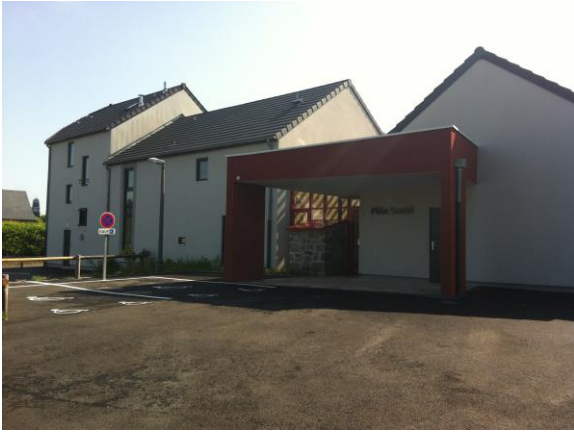
Maison de Santé de GIAT