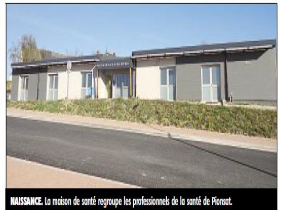
NAISSANCE. La maison de santé regroupe les professionnels de la santé de Pionsat.

Fruit d'un partenariat étroit entre la communauté de communes du Pays de Pionsat, porteur du projet et maître d'œuvre, et l'Agence régionale de santé, cet ensemble de 500m 2 regroupe la quasi-