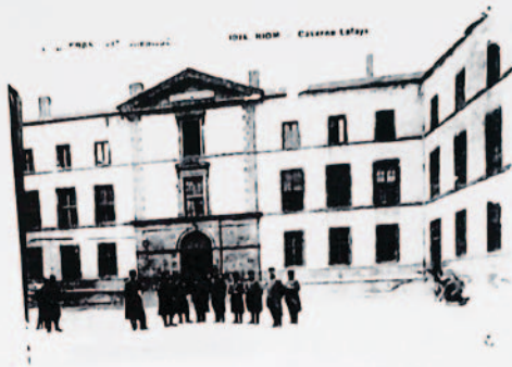
Carte envoyée de Riom le 4 mars 1915

il faudrait qu'il soit pistonné par le commandant au dépôt qui est un commandant ou un colonel. »