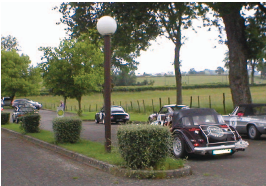
Rallye des Princesses le 6 juin au camping