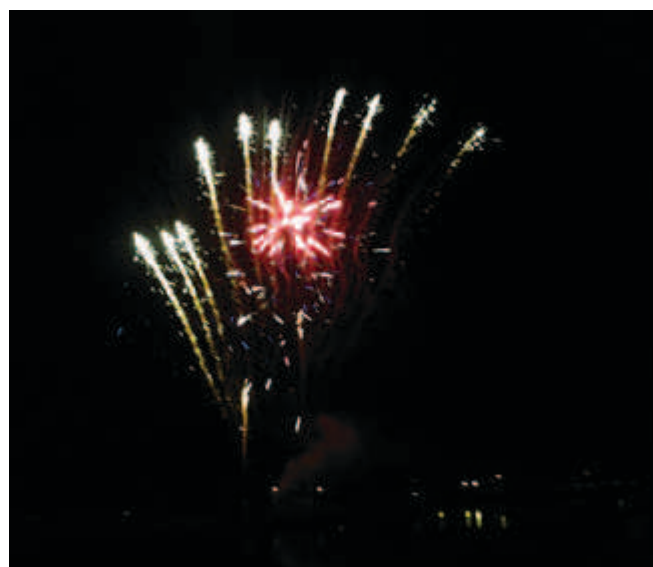
Un superbe feu d'artifice