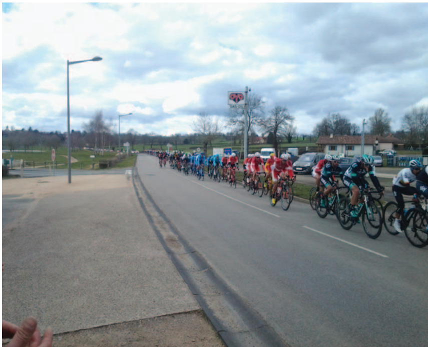
Passage du Paris-Nice le 6 mars 2018