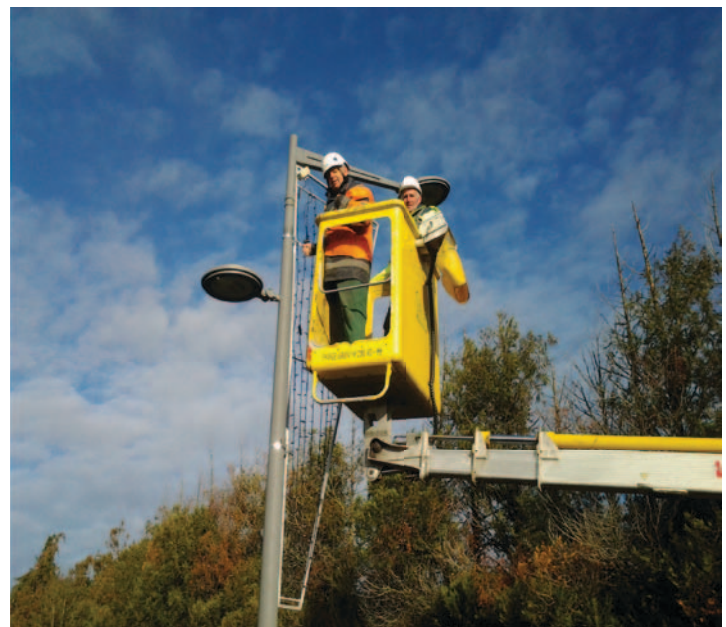
Pascal BLOIS et Fabrice BAYLOT en action

Les travaux ont été exécutés en trois jours. La commune a ainsi économisé la somme de 2 400 €.