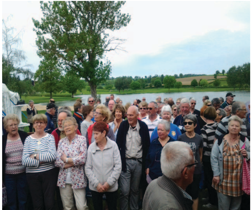
Concentration des campings-car les 4, 5 et 6 mai 2018