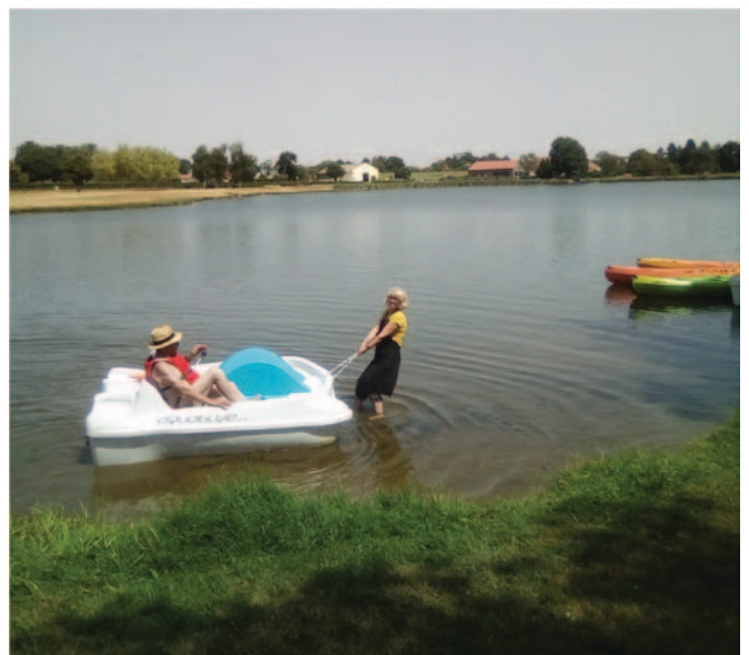
Des pédalos neufs, un vrai succès

De même, la commune a procédé à différentes acquisitions concernant le Centre de Loisirs de La Loge, c'est ainsi que deux pédalos ont été commandés pour le prix de 4 265 € et mis à disposition de la gérante du bar-buvette qui devait encaisser au titre de l'année 2018 un montant supérieur à mille euros.